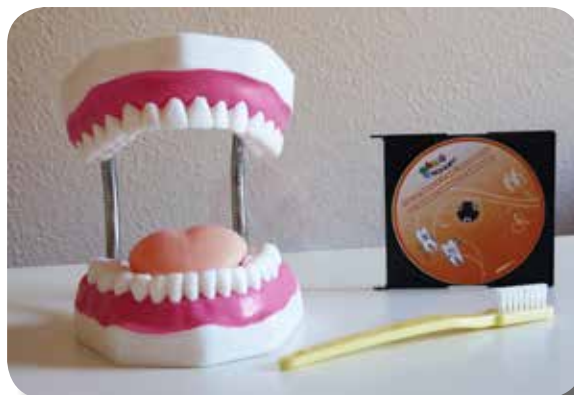
Maxi-Mâchoire & CD-ROM